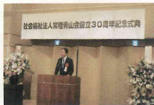
石岡市長 今泉 文彦様