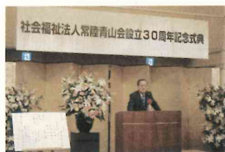
茨城県知事 橋本 昌様

今後とも、利用者・職員・保護者・施設・地域を大切にし、利用者の方々にとって安心・安全で快適な施設を目指して、努力してまいりますので、変わらぬご支援を賜りますよう、お願い申し上げます。