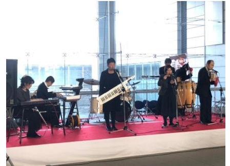
写真：チョコレートフェスティバルより

バンドカムカムでは、昨年10月に偕楽園で行われたラーメンフェス、2月に県庁で行われた世界チョコレートフェスティバルにてゲストとして演奏させて頂き、会場の皆様に音楽の楽しさを伝えることが出来ました。メンバーも演奏の機会を頂き、練習にも力が入っています。今後も皆様に音楽の楽しさを伝えていければと思います。