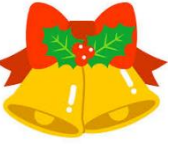
1/18 レクリエーション大会 (新年会)