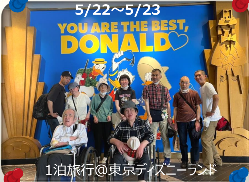
1泊旅行@東京ディズニーランド