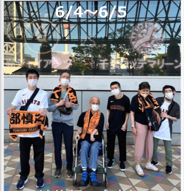
1泊旅行@東京ドーム